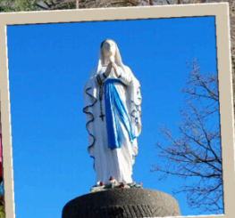
Vierge de Pommiers