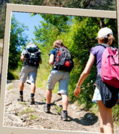
Marche de 8,6km