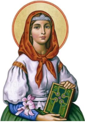
Portrait de sainte Dymphne de Geel, patronne des malades mentaux

Dans le diocèse de Nîmes, des professionnels du soin psychique ayant la foi catholique se sont constitués en réseau dans tout le Gard. Depuis 2022, ils se réunissent tous les trimestres, traitant de sujets variés. Ces échanges entre professionnels de la relation d'aide nourrissent profondément les pratiques et permettent de mieux appréhender les enjeux psycho-spirituels de notre temps.