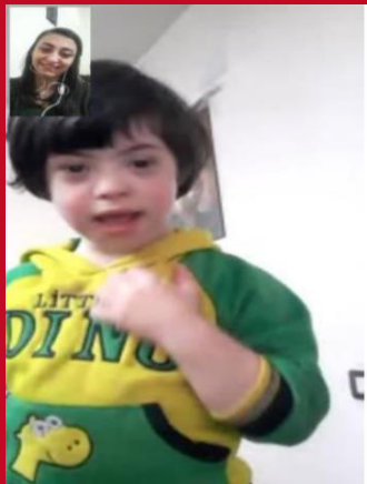
Suivi des enfants par leurs éducateurs pendant le