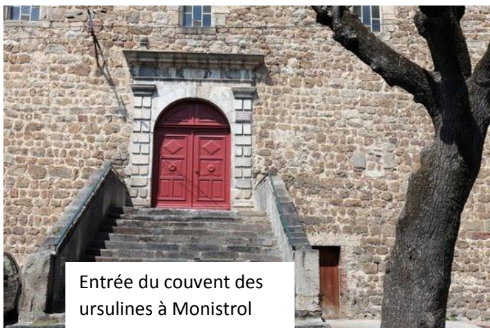
Entrée du couvent des ursulines à Monistrol